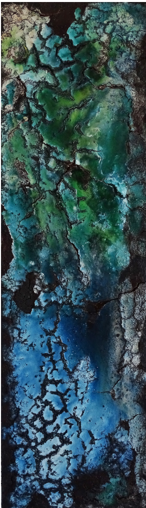
Lagune. Mixed Media, 30x100cm.