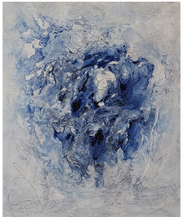
Gletscher. Mixed Media, 80x100cm.