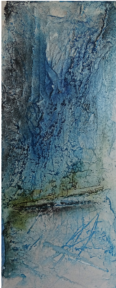
Gletscherschlucht. Mixed Media, 20x50cm.