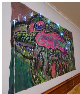
Mario Merz (1925-2003). Cocodrillo viola, 1990. Kunst Museum Winterthur Reinhart.

Eine weiss bemalte Leinwand, die in der Mitte aufgeschlitzt ist und so den Blick auf den hinter ihr liegenden Raum freigibt und diesen mit dem Bild verbindet. Damit wollte der Künstler das seit Jahrhunderten verwendete zwei-dimensionale Bild «überwinden».