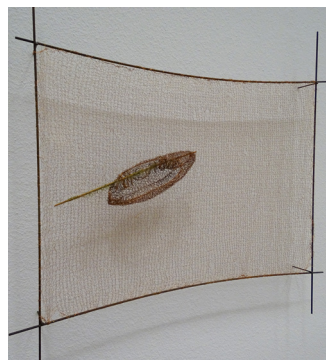
Marisa Merz (1926-2019). Scarpetta, 1970. Kunst Museum Winterthur Reinhart

Marisa Merz (1926-2019) verwendet bei ihrem Werk «Scarpetta» Kupferdraht und gestaltet damit sowohl den Hintergrund als den Schuh selbst. Der Hintergrund erscheint dabei wie ein Sandstrand. Damit schlägt sie den Bogen zu einer eigenen Aktion von 1970, als sie zwei Schuhe (Scarpette) den Wellen des Meeres überliess.