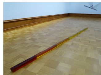
Francesco Gennari (1973). Autoritratto come moto di rotazione della terra, 2008.

Eine sehr ausgefallene Idee für ein «Selbstporträt». Es besteht aus farbigem Murano-Glas, das aus dem Lichtspektrum von kaltem Gelb bis zu warmem Rot besteht – so, wie wir es zwischen auf- und untergehen der Sonne wahrnehmen.