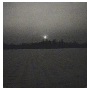
Giovanni Anselmo (1934). Documentazione di interferenza umana nella gravitazione universale, 1969-1999.