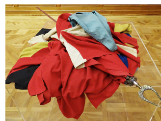
Giulio Paolini (1940). Averroè, 1967.

Eine sehr ausgefallene Idee für ein «Selbstporträt». Es besteht aus farbigem Murano-Glas, das aus dem Lichtspektrum von kaltem Gelb bis zu warmem Rot besteht – so, wie wir es zwischen auf- und untergehen der Sonne wahrnehmen.