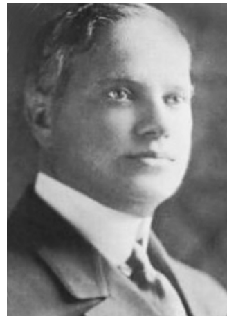
Benjamin Guggenheim, 1865-1912.

Guggenheim ist auch weltberühmt. Weil er 1912 in der berühmtesten Seetragödie der Welt zu Tode kommt: Er geht mit der Titanic unter. Aber nicht, ohne sich noch ein Denkmal zu setzen. Er soll seiner Begleiterin auf der sinkenden Titanic zu einem Platz in einem Rettungsboot verholfen, seinen Smoking angezogen und zu einem Crewmitglied gesagt haben: «We've dressed up in our best and are prepared to go down like gentlemen.» Die Geschichte wurde literarisch und filmisch verarbeitet.