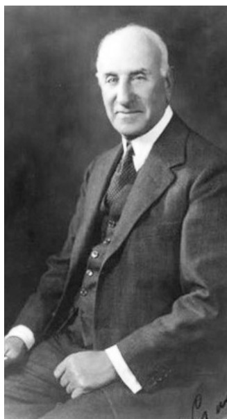
Solomon R. Guggenheim, 1861-1949.

Hier kann er seine und Hilla von Rebays Sammlungen zeigen. 1943 beauftragt er den Architekten Frank Lloyd Wright mit dem Entwurf eines komplett neuen Museums an der Fifth Avenue . Die Fertigstellung seines New Yorker Museums für moderne Kunst erlebt er nicht mehr – er stirbt am 3. November 1949 im Alter von 88 Jahren. Das Museum trägt bis heute seinen Namen.