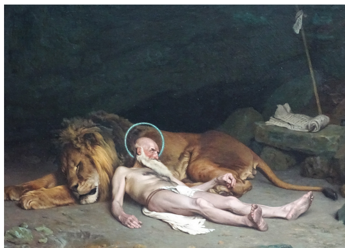
Jean-Léon Gérôme (1824-1904). Der heilige Hieronymus mit dem Löwen, 1874. Städel Museum Frankfurt.

Textquellen: Wikipedia und www.praedica.de , heilige