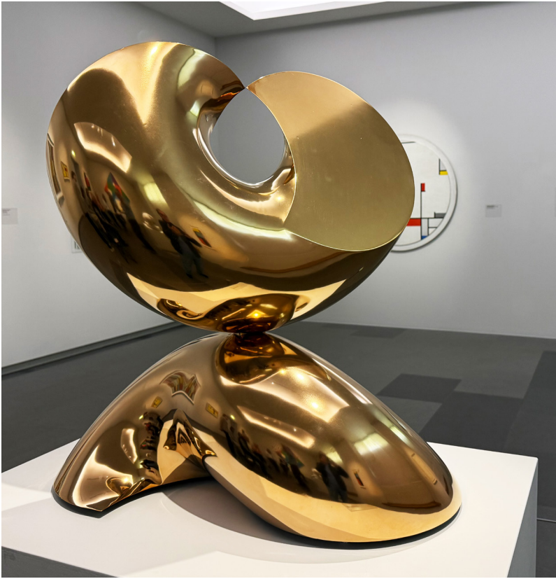
Max Bill (1908-1994). Konstruktion aus einem Kreisring, 1940-41. Kunsthaus Zürich.