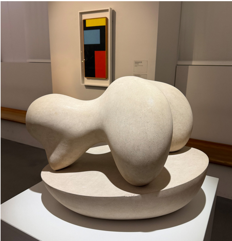
Hans Arp (1886-1966). Concrétion humaine, 1933. Kunsthaus Zürich.