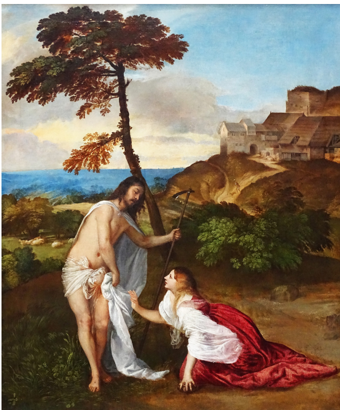
Tizian (1490-1576). Noli me Tangere, 1514. National Gallery London.

Das Bild der Sünderin und Hure hielt sich hartnäckig. Noch bis 1996 soll es in Irland «Magdalenenheime» gegeben haben – eine von katholischen Ordensschwwestern geleitete Organisation zur Aufnahme «gefallener Mädchen und Frauen». Immerhin: 2016 wurde sie vom Vatikan wieder als Apostelin bestätigt.