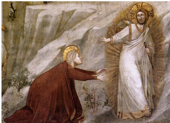
Giotto di Bondone (1266-1337). Noli me tangere, 1320. Jesus und Maria Magdalena. Basilika des hl. Franz von Assisi.

Konkret stammt der Satz aus dem Johannes-Evangelium im Neuen Testament, Kapitel 20, Vers 17. Die vollständige Passage lautet: Johannes 20:17: «Jesus spricht zu ihr: Rühre mich nicht an! Denn ich bin noch nicht aufgeföhren zu meinem Vater. Geh aber hin zu meinen Brüdern und sage ihnen: Ich fahre auf zu meinem Vater und eurem Vater und zu meinem Gott und eurem Gott.»