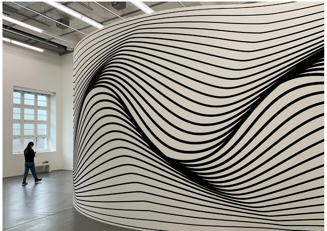
Claudia Comte (1983). Head and Tails, 2022. Haus Konstruktiv Zürich. Kaum zu glauben, dass es sich bei diesem Werk um eine flache Wand handelt, die dank geschickter Bemalung wie eine dreidimensionale Skulptur aussieht.

Wie entsteht eine optische Täuschung? Sie hängt mit dem Zusammenspiel von Auge und Gehirn zusammen. Gerade Gesehenes wird mit «alten» Erfahrungen verknüpft, es können dadurch Illusionen oder Sinnestäuschungen entstehen.